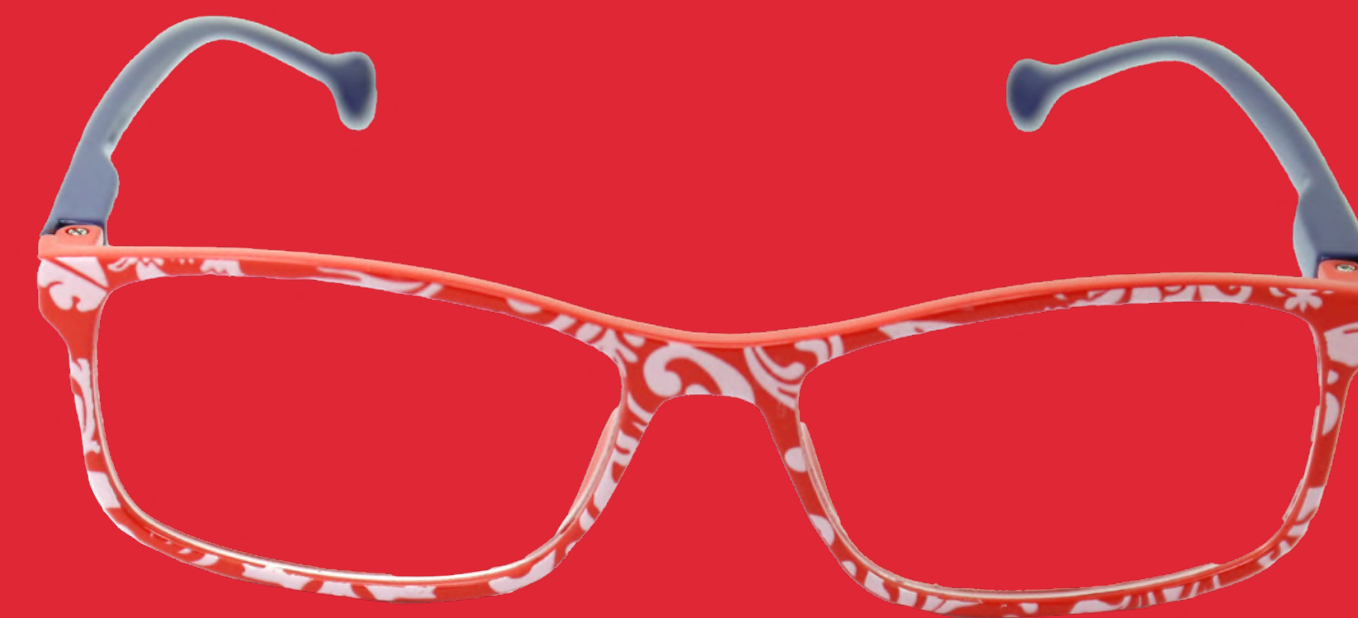
CASTELLÓN CAPRILE AZUL by Caprile