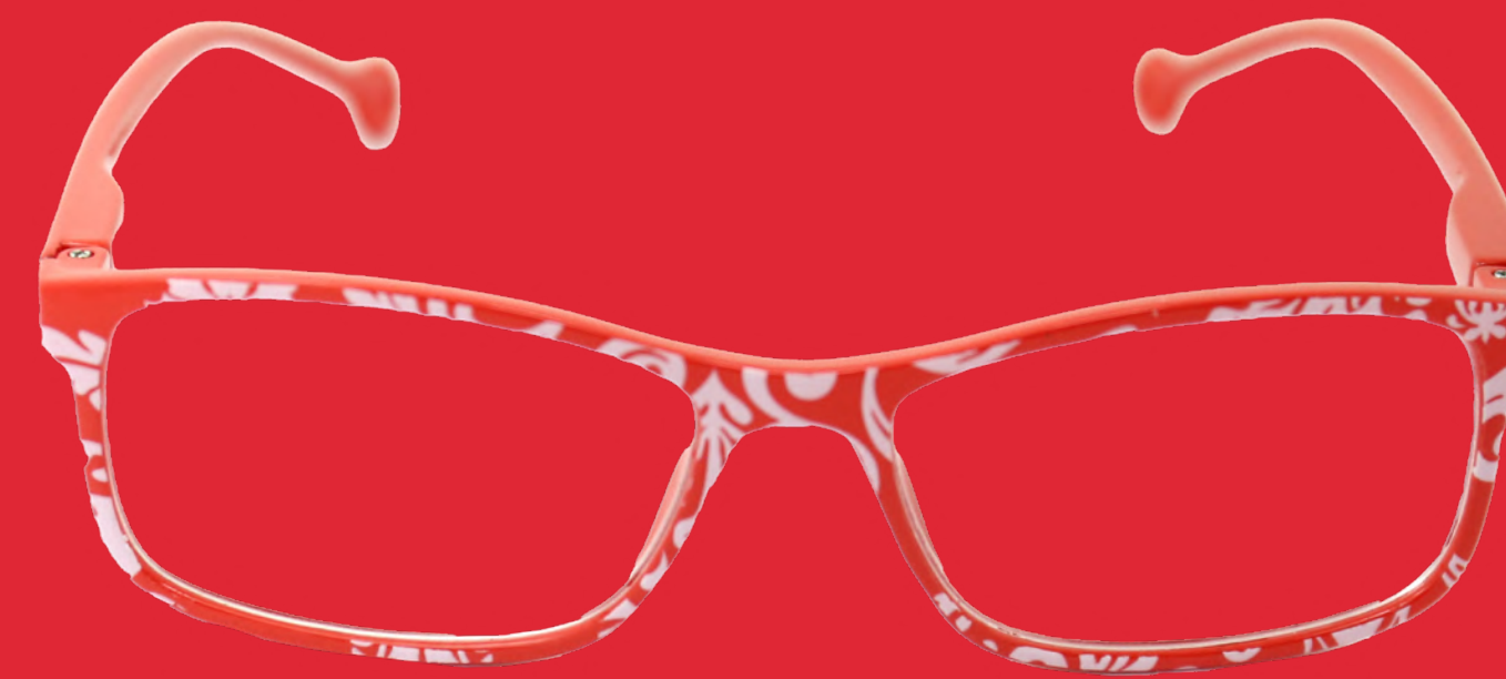
CASTELLÓN CAPRILE ROJO by Caprile